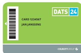
persoonkaart met uw naam